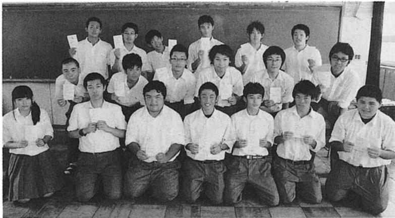
測量士補試験合格を喜ぶ生徒ら＝北方町北方、岐阜農林高校