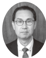
岐阜農林高等学校